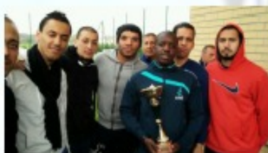
Victoire lors d'un tournoi à Dunkerque